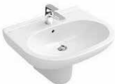
Wastafel V&B O Novo