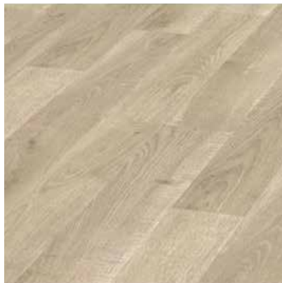
Cutter Oak D2450