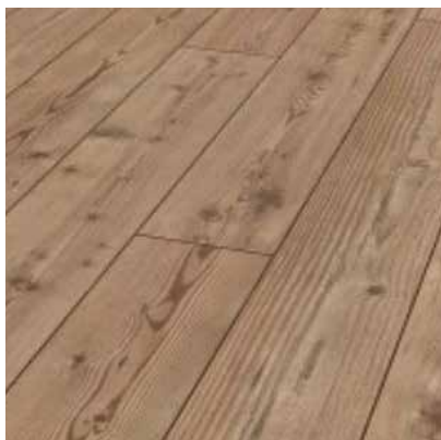
Natural Pine D2774