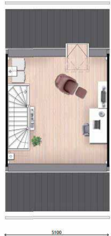
2a variant 2a