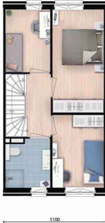
1b variant 1b