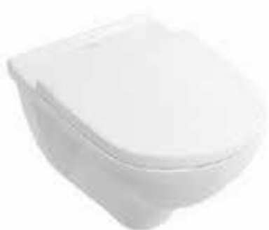
Wandcloset V&B O Novo