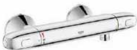
Douchemengkraan F Grohe 1000