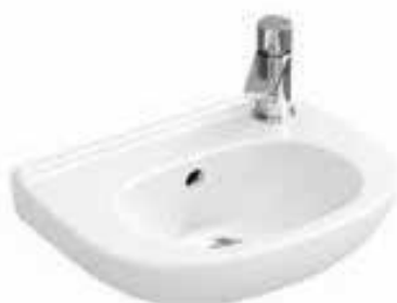
Fontein V&B O Novo