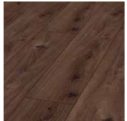
Prestige Oak Dark D4168