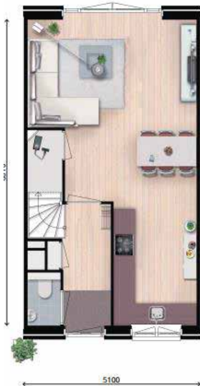
1a variant 1a