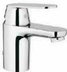
Mengkraan met ketting F Grohe Eurosmart Cosmo