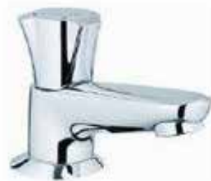
Fonteinkraan F Grohe Costa-L